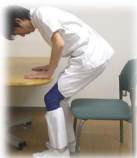
立ち上がる・座る