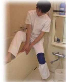
浴槽を腰掛けてまた