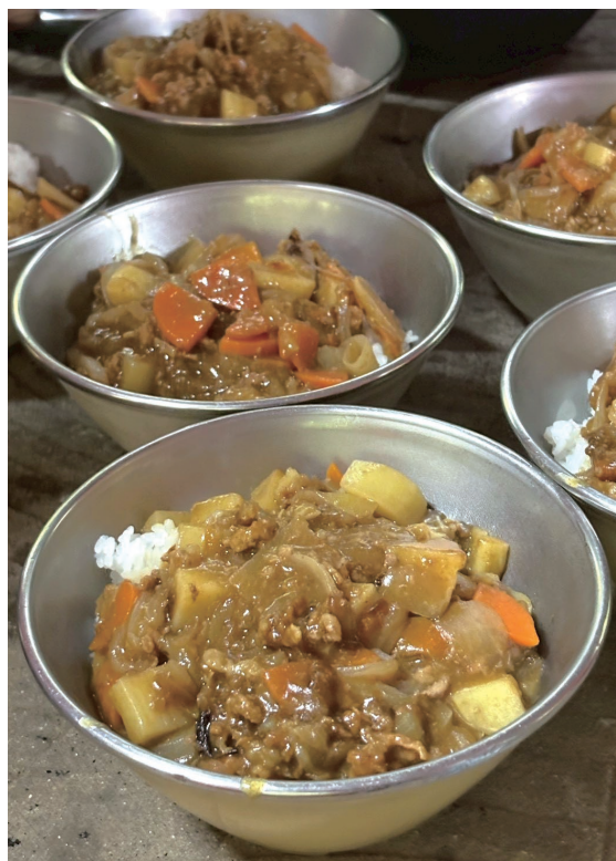
飯盒炊飯で作ったカレー