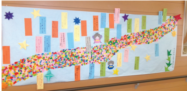
塗り絵に交じって、すでに七夕飾りの製作開始!

このように、塗り絵は大人の趣味としての流行を超え、老人介護やリハビリテーションにおいて多面的な効果を持つ重要な活動として広がり続けています。