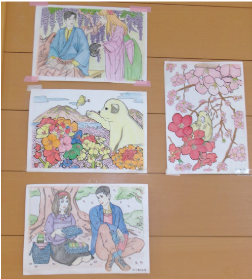
塗り方も配色も綺麗