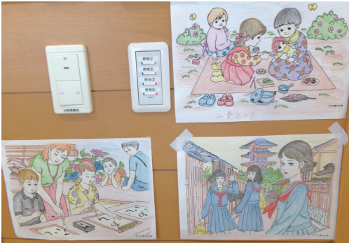
塗り終わったものは色々な場所で掲示

近年、書店や雑貨店では「大人の塗り絵」が人気を集めています。繊細な模様や美しい風景を彩ることでリラクゼーション効果が得られるとされ、ストレス解消の手段として幅広い世代に受け入れられています。この流行は、老人介護やリハビリテーションの現場にも大きな影響を与えています。塗り絵は単なる娯楽ではなく、高齢者の心身機能を支える有効なアクティビティとして注目されているのです。 まず、塗り絵は手指の巧緻性を高める訓練として優れています。色鉛筆を握り、線に沿って丁寧に色を塗る動作は、指先の筋力維持や細かな動きの改善につながります。これは日常生活動作の維持にも直結し、リハビリテーションの一環として非常に効果的です。 さらに、塗り絵は認知機能の活性化にも寄与します。色を選ぶ、構図を考える、完成をイメージするなどの過程が脳を刺激し、