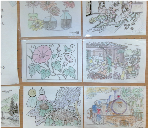
かなり細かな塗り絵