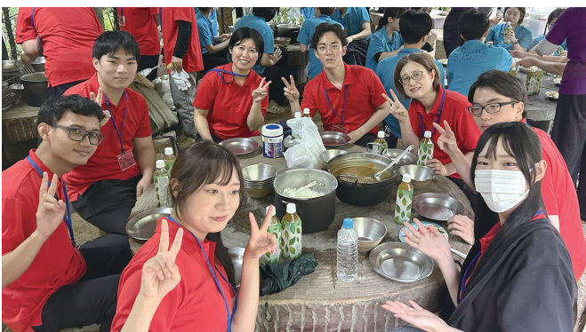
皆で協力しました