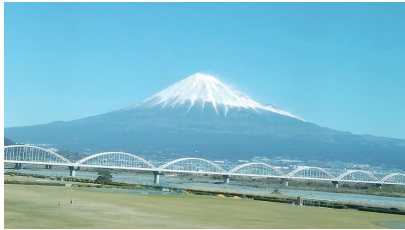
新幹線からの富士山