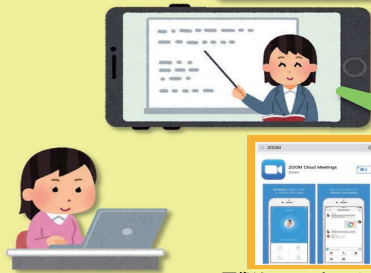
※画像は、スマートフォン版です。

オンライン医療講座は Web会議ツール「Zoom」ソフトを使用いたします。 みなさまには事前に「Zoom」のダウンロード等をお願いいたします。