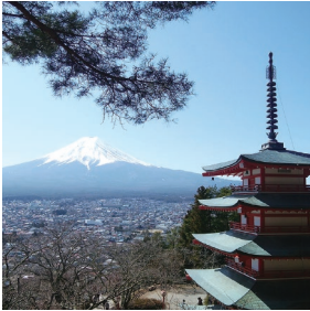
新倉山浅間公園からの富士山