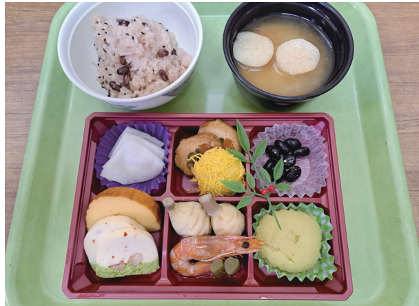
2023年 お正月 おせち