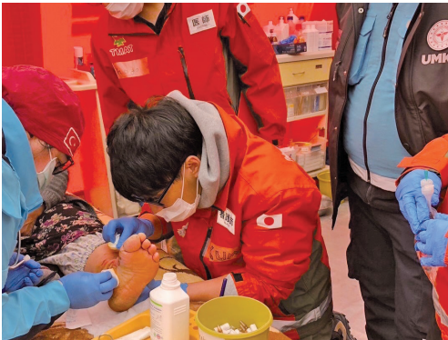
処置にあたるTMAT隊員

気温は氷点下になることもあり、多くの方がテント生活を余儀なくされています。これから外傷のみでなく呼吸器疾患等も増えてくること予想されます。TMATは引き続き、トルコ共和国の支援を行っていきます。この地震で亡くなられた多くの方のご冥福をお祈りします。