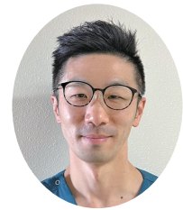
ICU主任 クリティカルケア認定看護師 NPO法人TMAT隊員