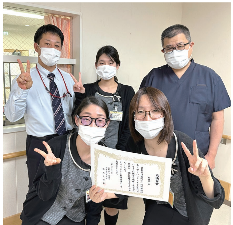
総務課初! 最優秀賞受賞!

様々な業務に対しての取り組みがあり、ヒヤリハットや業務改善の意識の高さを感じました。自部署でも参考にし、より積極的に取り組んで行きたいと思います。