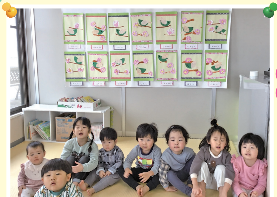
和紙に桃色の絵の具をにじませて梅の花をつくりました。春がくるのを楽しみに待つ子ども達です。