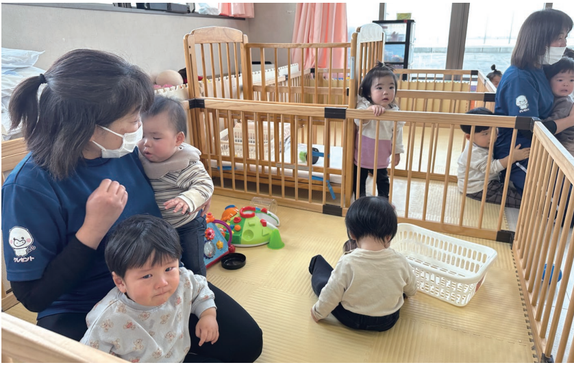
大迫力の鬼さんにびっくり