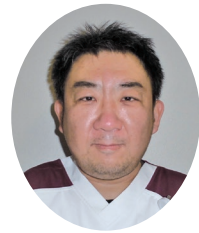
棟高 宜 北病棟 4階 泉野

こう見えて、祭り男です。生まれも育ちも金田(かなた、堺市金岡町)です。金田では、江戸時代