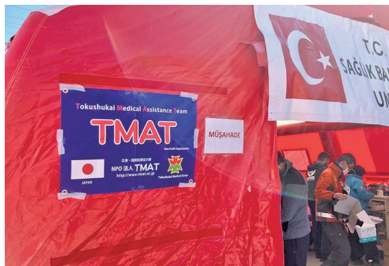
現地の特設診療所