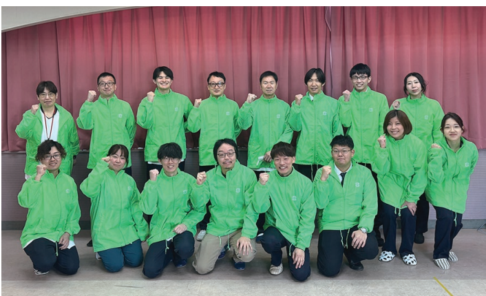
災害対策委員で集合写真