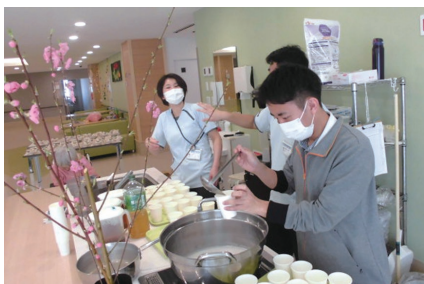
美味しそうな甘酒を配ります