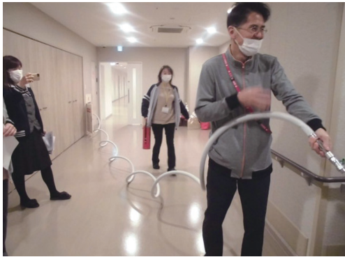
施設内で火災発生！散水栓で消火作業！