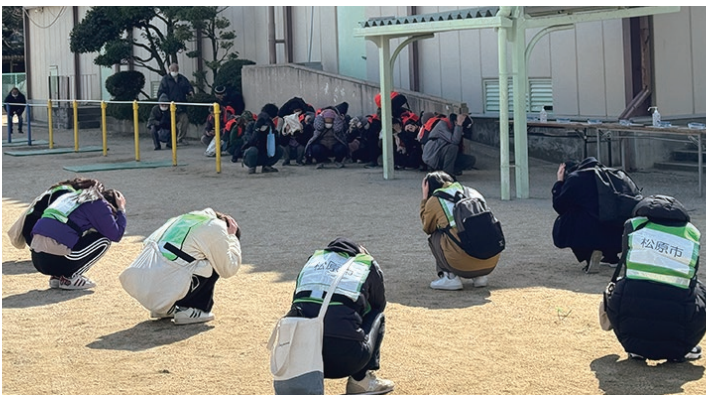
みんなでシェイクアウト訓練