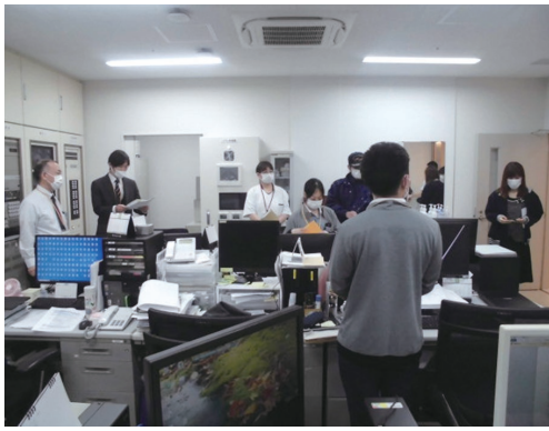
災害本部立ち上げ

今回は松原市消防本部に協力をいただき、初めての防災訓練を実施しました。地震発生から災害対策本部設置、アクションカード内容の報告、安否確認、火災発生時の施設内消火器具の操作確認を目的とした訓練です。 地震発生からすべての部署の報告があがるまで、実際に施設内放送での呼びかけを行い、個々の職員がどう動くべきなのかを考えて取り組みました。 地震に伴い屋内で火災が発生することも想定し、消火用散水栓の操作方法や消火器の使い方を現役の消防隊員の方に教えていただきました。災害はいつ起こるかわかりません。今後定期的な訓練を実施していきたいと思えます。