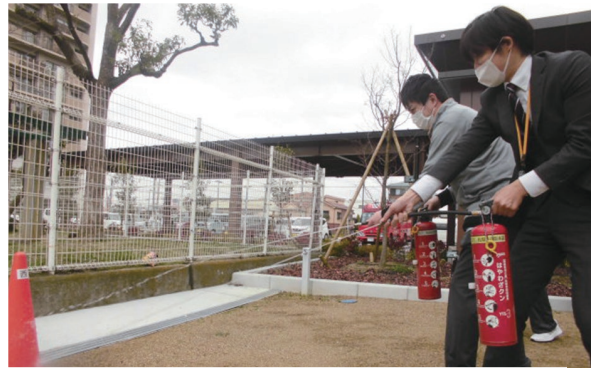
消火器を実践使用