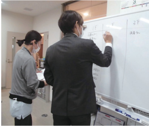
各部署から報告を聞く災害対策委員長

今回は松原市消防本部に協力をいただき、初めての防災訓練を実施しました。地震発生から災害対策本部設置、アクションカード内容の報告、安否確認、火災発生時の施設内消火器具の操作確認を目的とした訓練です。 地震発生からすべての部署の報告があがるまで、実際に施設内放送での呼びかけを行い、個々の職員がどう動くべきなのかを考えて取り組みました。 地震に伴い屋内で火災が発生することも想定し、消火用散水栓の操作方法や消火器の使い方を現役の消防隊員の方に教えていただきました。災害はいつ起こるかわかりません。今後定期的な訓練を実施していきたいと思えます。