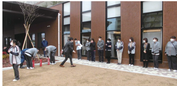
参加者は全員消火器訓練！