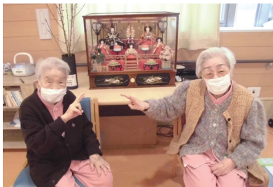
ひな人形の前で「はいチーズ」