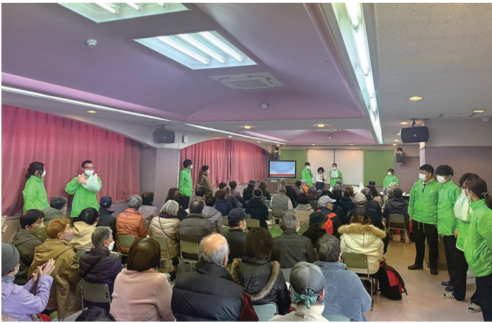
82名の地域の方が聴講

今後も松原市の災害を想定した活動を続けていき、いざ災害が起こったときに市民の方と協同して1つでも多くの命を助けたいと思います。