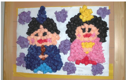
皆で作ったお雛様