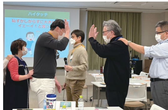
じゃんけんハイタッチゲーム