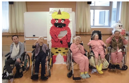
記念撮影。はいチーズ!