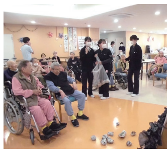
実習中の生徒の皆さんも参加