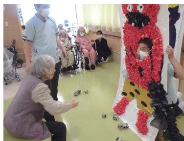
俺に向かって投げろー!