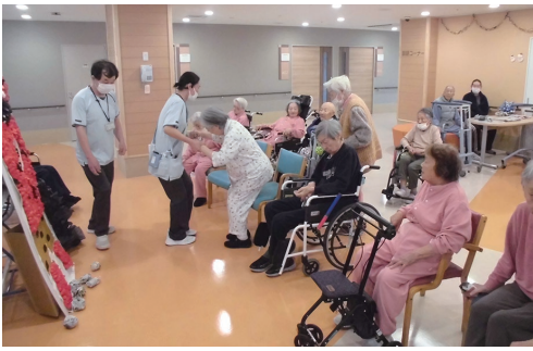
イベント開始! みんな集合

毎日リハビリで頑張つて体を動かしている利用者の皆さんですが、力いっぱい物を投げる！という機会が入所しているとなかなかありません。一人当たり3球！としてた為か一球一球を大事にしながら狙いを定めて鬼に向かってボールを投げ、的に入ると鬼の後ろで控えている職員が鬼を上下に動かしながら「うおお」と雄たけびを上げる演出に驚きつ