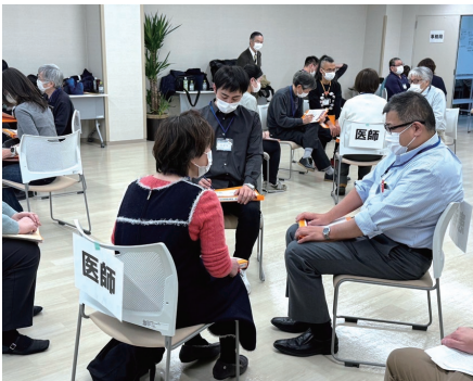
がん医療におけるコミュニケーション