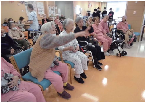
第一球! 投げました!