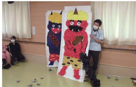
職員と並ぶとその大きさがよくわかる