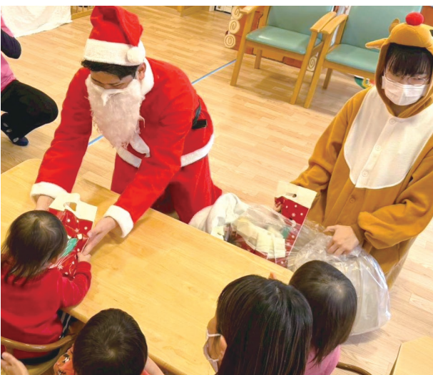
サンタさんからお菓子のプレゼント♪