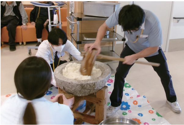
まずはもち米をやさしく押しつぶします