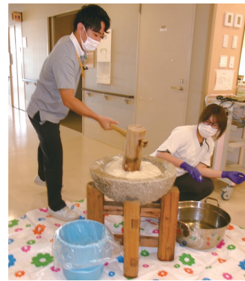
ここからは男の仕事!