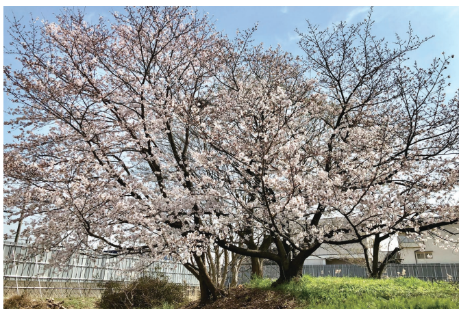
老健建設前にあったさくらの樹