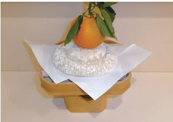
鏡餅完成～ だいだいが立派