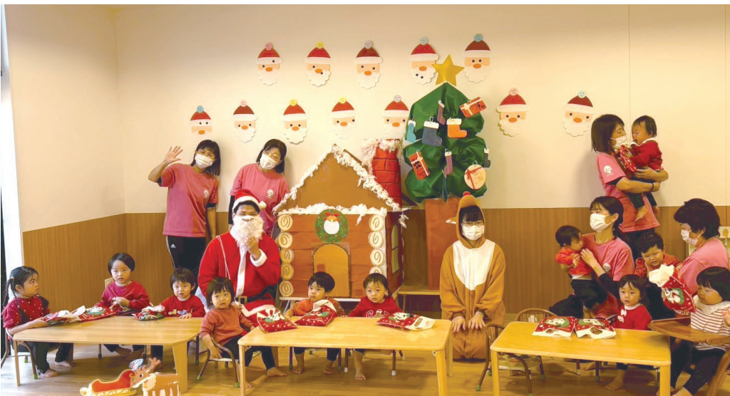
皆で記念にはいチーズ📸

サンタとトナカイからは、一人ずつお菓子のプレゼント📦 お返しに【あわてんぼうのサンタクロース】を元気いっぱい歌ってくれました♪ 短い時間でしたが、笑顔あふれる素敵なクリスマス会になりました。 また来年も会おうね🌟