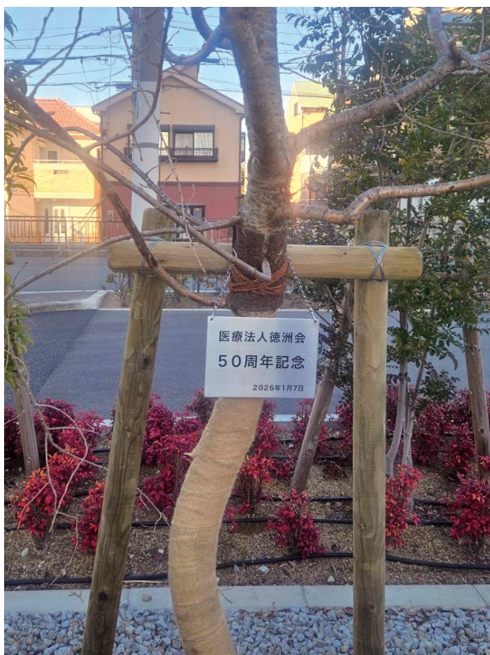
50周年 シダレザクラ

松原徳洲苑の敷地内に、医療法人徳洲会50周年記念として遅くなりましたが枝垂れ桜を植樹しました。 弁天池を埋め立てて松原徳洲苑の建築が始まりましたが、埋め立てる前には立派な桜の木があり春には満開で桜のスポットとして長年地元の皆様に親しまれました。 伐採した際なんとかこの桜をもう一度咲かせたいと思い、色々取り組みましたが残念ながら同じ桜を植樹することが叶いませんでした。 今回植樹した枝垂れ桜も地域の皆様に親しまれる立派な花を咲かせて欲しいと思います。 この春は間に合いませんが皆さん桜の成長を楽しみにしてください。