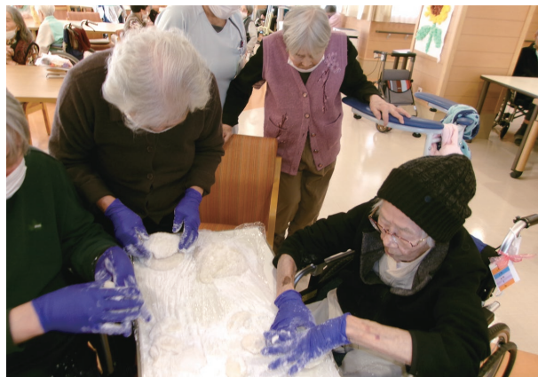
お持ちを個別に整形していきます