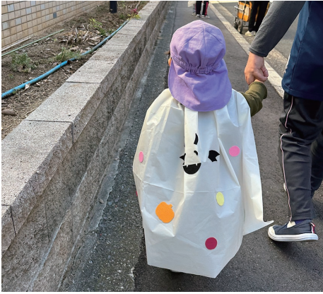
マントを着てお散歩♪