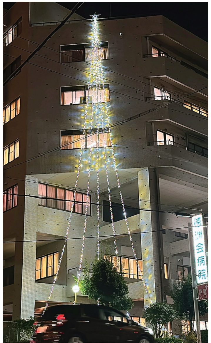
今年はシャンパンゴールドです!