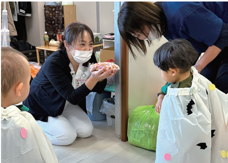
看護部長よりお菓子のプレゼント(^^)

10月31日に、にじいろ保育園にて、ハロウィンパーティーを開催しました！ 新型コロナウイルス感染症が流行する前は、仮装した子どもたちが病院まで遊びに来てくれましたが、感染症拡大防止の為、今年も仮装した子ども達に会いに行つてきました。 可愛い手作りマントで仮装した子ども達は「トリック・オア・トリート！ お菓子をくれなきゃいたずらするぞー！」と、元氣よくハロウィンを楽しんでくれていました。 来年こそは、子ども達が病院まで姿を見せに来れるようになる事を願っています。