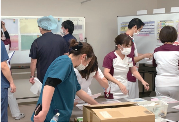
各部署から情報収集