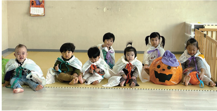
かぼちゃおぼけさんと「はいチーズ」