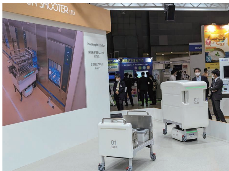
手術室、中央材料室でのロボット運用