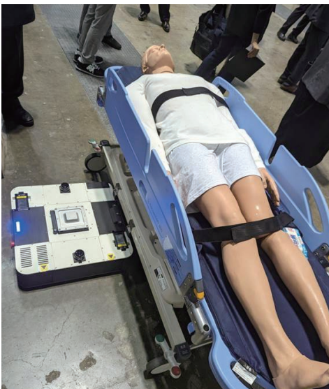
搬送アシストロボット

既存施設での導入は困難なものもありますが、より良い病院を目指して、様々な提案が出来る様、引き続き情報収集と知見を深めて参ります！