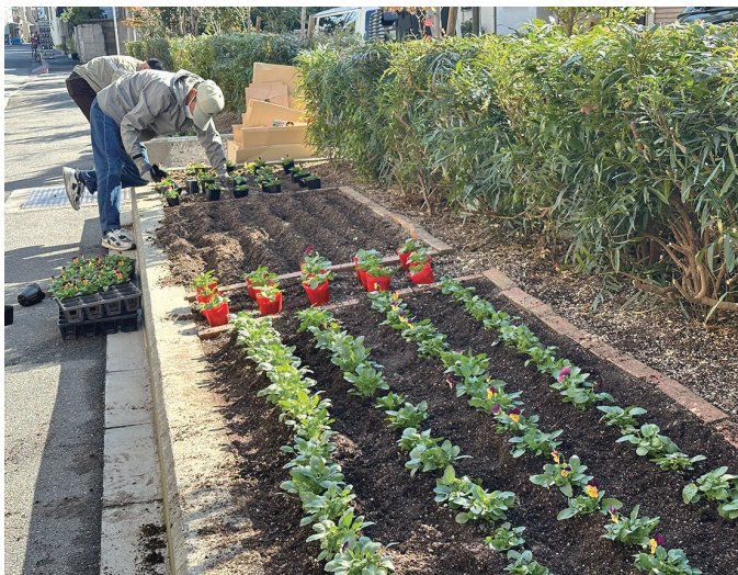
ボランティアの皆様、ご協力ありがとうございます