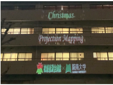
プロジェクションマッピング