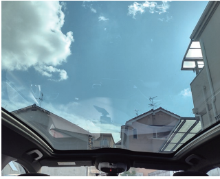
車内から外の景色は最高です