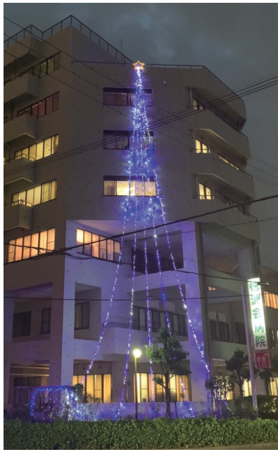
病院のイルミネーション