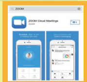
※画像は、スマートフォン版です。

オンライン医療講座は Web会議ツール「Zoom」 ソフトを使用いたします。 みなさまには事前に 「Zoom」の ダウンロード等 をお願いいたします。