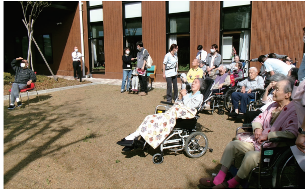
見上げるにはちょっと眩しいかな？