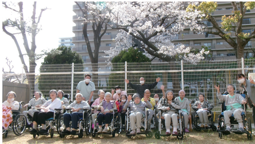
皆さん思い思いのポーズで